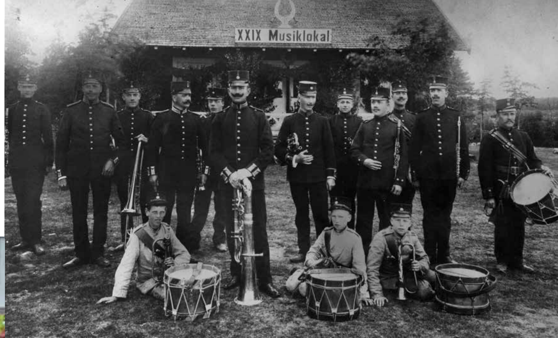
Delar av Kronobergs regementets musikkår utanför sin övningslokal, kallad "Tutaryd" i folkmun, på Kronoberghshed, 1904.

Ett fylligt referensbibliotek är öppet för våra besökare. Där finns böcker och tidskrifter inom musik- och danshistoria, kultur- och lokalhistoria samt etnologi.