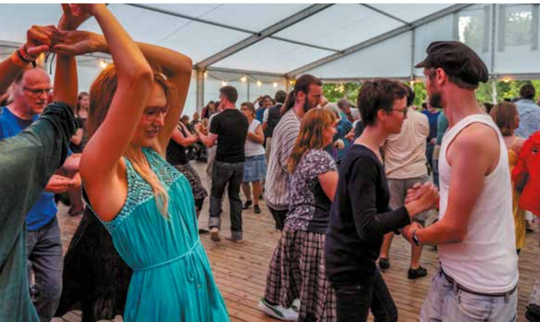
Korrö Folkmusikfestival sommaren 2015.

Smålands Musikarkiv är en samarbetspartner till musik- och danslivet, forskarvärlden, olika utbildningsinstitutioner och en resurs för allmänheten. Arkivet är en del av Musik i Syd vilket bland annat innebär att vi är med och arrangerar Korrö Folkmusikfestival.