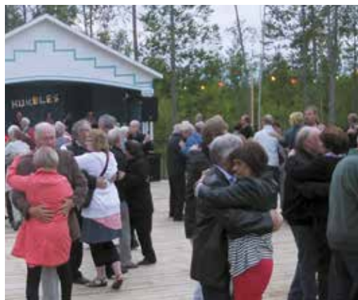
Rävemåla dansbana, byggd 1937, återinvigdes sommaren 2013. Många andra dansbanor från förr, med de tids- typiska kulörta lamporna, är idag borta.

I Smålands Musikarkiv finns stora samlingar av unikt musik- och dansmaterial från i första hand Kronobergs län, Småland och södra Sverige. Arkivet är öppet för alla och har till uppgift att vara en källa och kunskapsbas för utveckling av det regionala musik- och danslivet.